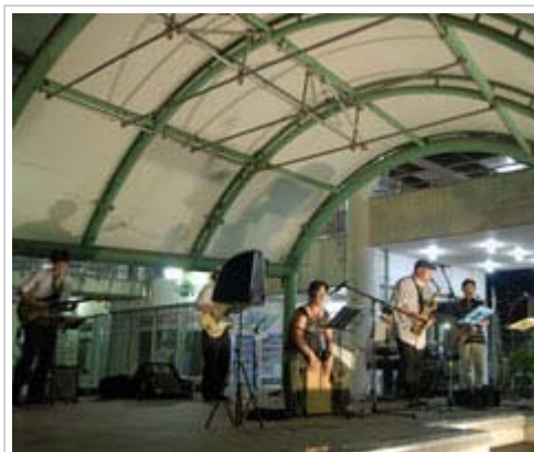
スタンダード工房の演奏風景(昨年のモール505縁日ライブ)

昨年、メンバーと意思統一を図り「演奏者と商店の橋渡し」や「長期的に継続可能な小さなステージを日常的に提供する」「ステージ運営のノウハウの共有化」「最小の経費で経済効果を上げる仕組みづくり」「土浦に特化した音楽情報HPの運営」を音レンコンの柱にして本格始動。現在、登録演奏者は19組を数え、今年の「名店街ひなまつり」や4月の「つちコンライブ」もバックアップ。